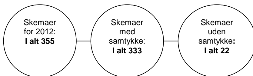
Figur 2. Oversigtsfigur for skemaer i 2012

Tabel 10 viser, hvordan de 333 behandlingsforløb fordeler sig på det enkelte center. Antallet af behandlingsforløb i de enkelte centre varierer fra ét (KRIS Hovedstaden) til 76 (Støttecenter mod incest) 1415 . Den store spredning i antal kan forklares med flere forhold, såsom geografi, centrenes størrelse, kapacitet og indhold. Nogle af centrene er alene baseret på frivillig arbejdskraft, mens andre centre fungerer med lønede psykologer og/eller psykoterapeuter tilknyttet.